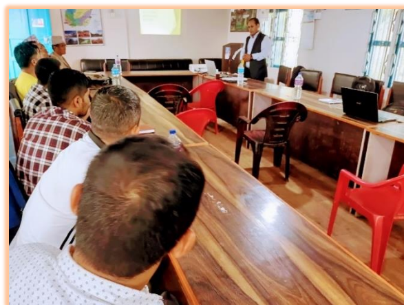
चित्र १ : अभिमुखीकरण कार्यशाला गोष्ठीको एक झलक

प्रारम्भिक बैठकमा तय गरिएको मिति र समयमा २०७९ साल जेष्ठ २१ गतेका दिन अभिमुखीकरण कार्यशाला गोष्ठीमा आयोजना गरिएको थियो जसमा २१ जनाको सहभागिता रहेको थियो ।